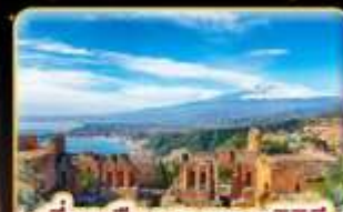
เที่ยวเมืองสวยเกาะซิซิลี Taormina