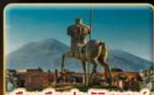
เยือนเมืองประวัติศาสตร์ ปอมเปอี