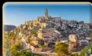
ตามรอย 007 เมือง Matera