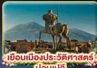
เยือนเมืองประวัติศาสตร์ ปอมเปอี