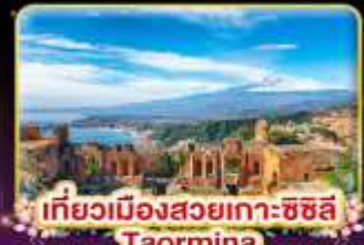
เที่ยวเมืองสวยเกาะซซิลี Taormina