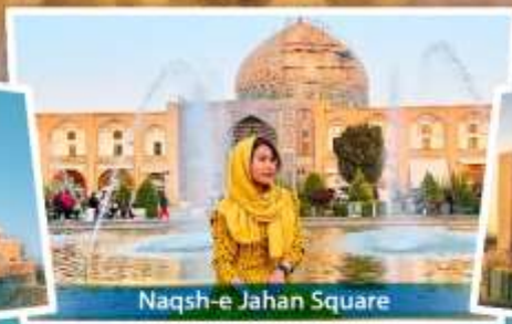
Naqsh-e Rostam Square