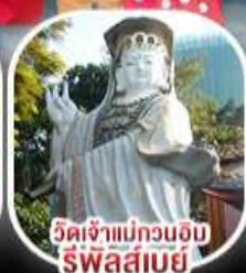
วัดเจ้าแม่กวนอิม รีพัลส์เบย์