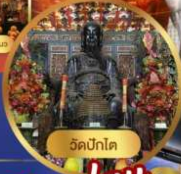
วัดปึกโต