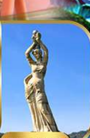
จูไห่ฟิชเชอร์ทิวรา