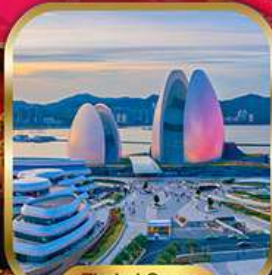
Zhuhai Opera House