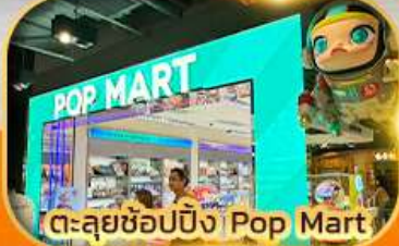
ตะลุยช้อปปิ้ง Ping Pop Mart