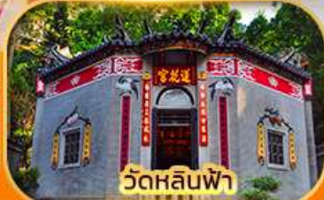
วัดหลินฟา