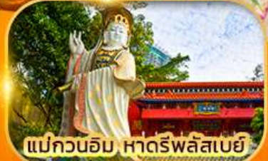
แม่กวนอิม หาดรีพลัสเบย์