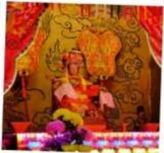
เจ้าแม่กัมม จอสเฮาส์เบย์