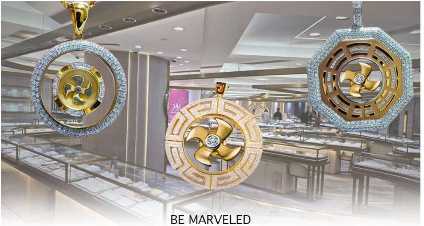
BE MARVELED ศูนย์ฮวงจุ้ย กังหันเศรษฐี

นำท่านชม ศูนย์ฮวงจุ้ย กังหันเศรษฐี ที่ขึ้นชื่อของฮ่องกง ท่านจะได้พบกับงานดีไซน์ที่ได้รับรางวัลยอดเยี่ยม และใช้ในการเสริมดวงเรื่องฮวงจุ้ย โดยการย่อใบพัดของกังหันที่เป็นสัญลักษณ์ของวัตต์แดงหงมิว มาทำเป็นเครื่องประดับ ไม่ว่าจะเป็นจี้, แหวน, กำไล หรือต่างหูเพื่อเป็นเครื่องประดับติดตัว และเสริมดวงชะตา ซึ่งสินค้าทุกชิ้นนี้ มีเอกสาร รับประกันคุณภาพเปลี่ยนหรือ ซ่อม ได้ตลอดอายุการใช้งาน หากเกิดการชำรุดจากสินค้าไม่ใช่อุบัติเหตุ