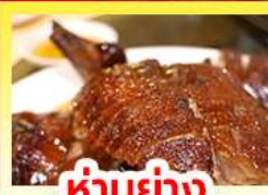
ห่านย่าง