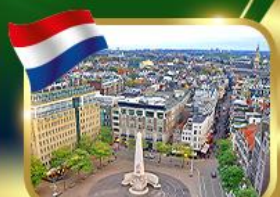
จัตุรัสดีสนีย์ฮอลล์ อัมสเตอร์ดัม