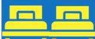
ห้องพักเตียงคู่ TWIN