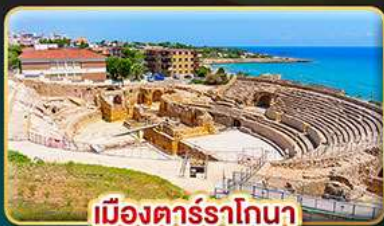
เมืองคาร์ราโกนา