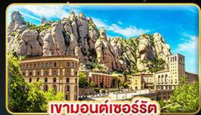
เขามอนต์ซอร์ริต