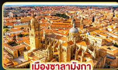
เมืองซาลามังกา