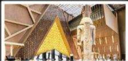
พิพิธภัณฑ์แกรนด์อียิปต์(GEM)

อารยธรรมลุ่มแม่น้ำไนล์ - พีรามิด - อเล็กซานเดรีย - แมมฟิส - ไคโร - โรงแรมระดับ 4 ดาว รวมค่าวีซ่า ตะลุยกะเลทราย - อาหารครบทุกมื้อ