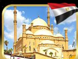
มัสยิดโอบอัมหมัดอาลี