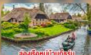
ล่องเรือหมู่บ้านทึร์รัน