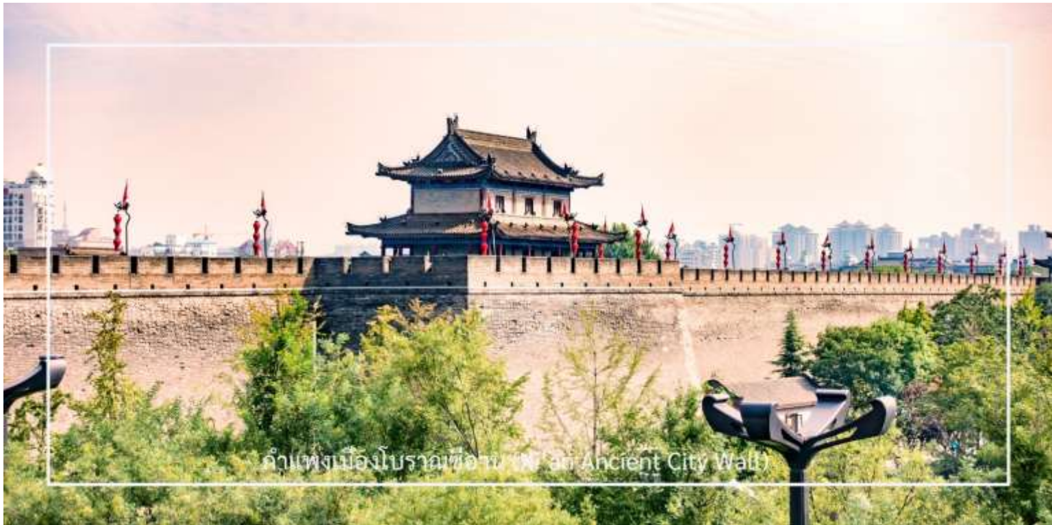
กำแพงเมืองโบราณซีอาน (Xi'an Ancient City Wall)

นำท่านขึ้นชม กำแพงเมืองโบราณซีอาน (Xi'an Ancient City Wall) อีกหนึ่งกำแพงเมืองโบราณเก่าแก่และสมบูรณ์ที่สุดของจีน สร้างขึ้นในสมัยราชวงศ์หมิงเมื่อกว่า 600 ปีก่อน มีความยาวโดยรอบประมาณ 13.7 กิโลเมตร กว้าง 12-14 เมตร และสูงราว 12 เมตร ออกแบบอย่างแข็งแกร่งเพื่อการป้องกันเมือง โดยมีป้อม ประตูเมือง และคูน้ำล้อมรอบ ปัจจุบันกลายเป็นแหล่งท่องเที่ยวยอดนิยม นักท่องเที่ยวสามารถเดินเล่นหรือปั่นจักรยานบนกำแพง เพื่อชมทัศนียภาพของเมืองซีอานทั้งภายในและภายนอกเขตกำแพงได้อย่างชัดเจน