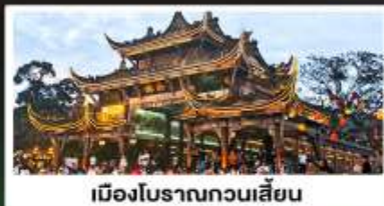
เมืองโบราณกวนเสียน