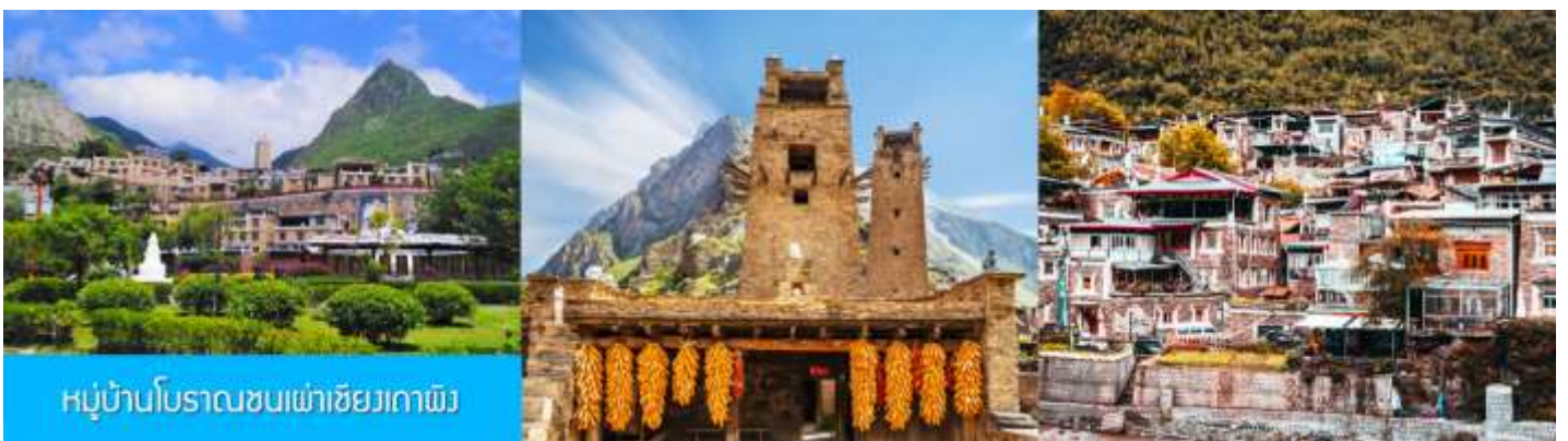
หมู่บ้านโบราณซบเผ่าชียงกาแพ็ง