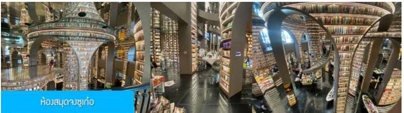
ห้องสมุดจวงซูเก้อ

หลังอาหารนำท่านชม สะพานหนานเฉียว 南桥 สะพานโบราณคร่อมแม่น้ำตูเจียงเยียนจีนชื่อที่ได้กลายเป็นแหล่งท่องเที่ยวสำคัญและจุดเช็คอินสำหรับนักท่องเที่ยว ในช่วงค่ำที่นี่จะประดับประดาด้วยแสงสี บริเวณริมน้ำจะถูประดับด้วยแสงไฟสีฟ้าที่ทอดยาวไปตามแนวแม่น้ำ ชาวบ้านตั้งชื่อว่าเป็น น้ำตาสีฟ้า 蓝色眼泪 พักที่ โรงแรม MINGZHISHANGCHUN HOTEL ระดับ 4 ดาวท้องถิ่นหรือเทียบเท่าในเมืองตูเจียงเยียน