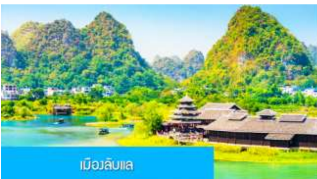
เมืองลับแล

ให้ท่านพักผ่อนตามอัธยาศัยในโรงแรม หรือท่านสามารถเลือกซื้อโปรแกรมเสริม