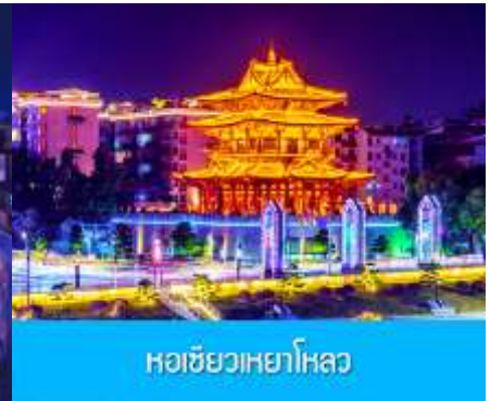
หอชิวเหยาโหลว

จากนั้นให้ท่านอิสระเดินเล่น ซ้อปั้ง ย่าน ดงซีเจียง 东西巷 ที่เป็นแหล่งช้อปปิ้งแห่งใหม่ของเมืองกุ้ยหลิน ในย่านนี้นอกจากท่านจะสามารถเดินชม หรือเลือกซื้อสินค้าแล้ว ที่นี่ยังเป็นแหล่งรวมของร้านอาหาร In trend