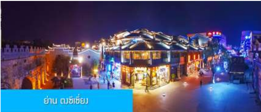
ย่าน ดงซีเจียง