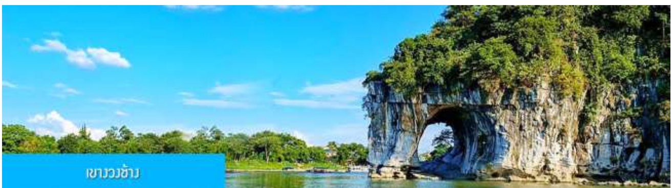
เขาวงกตช้าง

ในรูป (ระยะทาง 177 กม. ใช้เวลาเดินทางราว 2 ชั่วโมงเศษ)