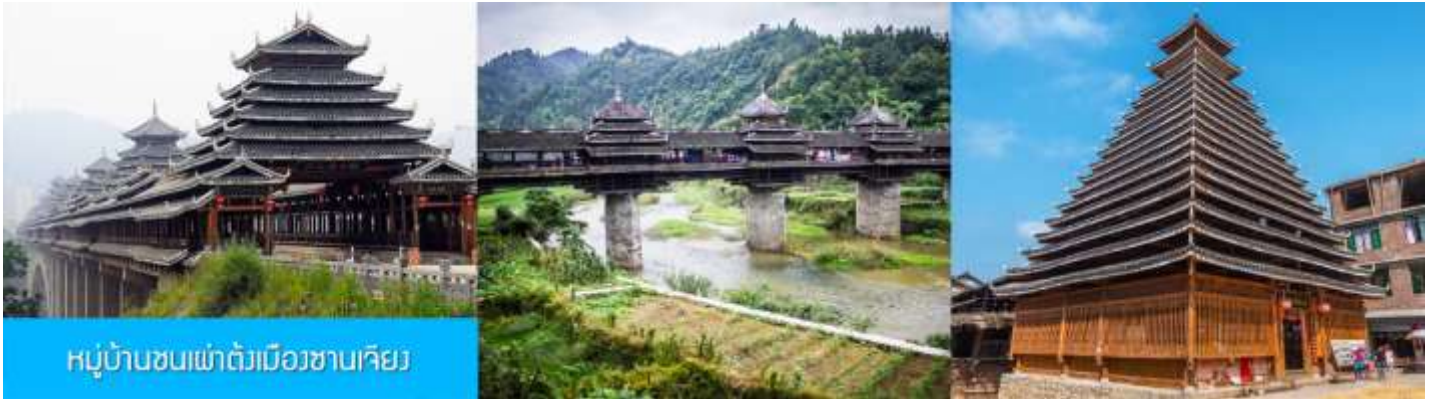
หมู่บ้านชนเผ่าต้งเมืองซานเจียง

พักที่ KAILI SHIMAO HOTEL โรงแรมระดับ 4 ดาวท้องถิ่น หรือเทียบเท่าในเมืองไค่หลี่