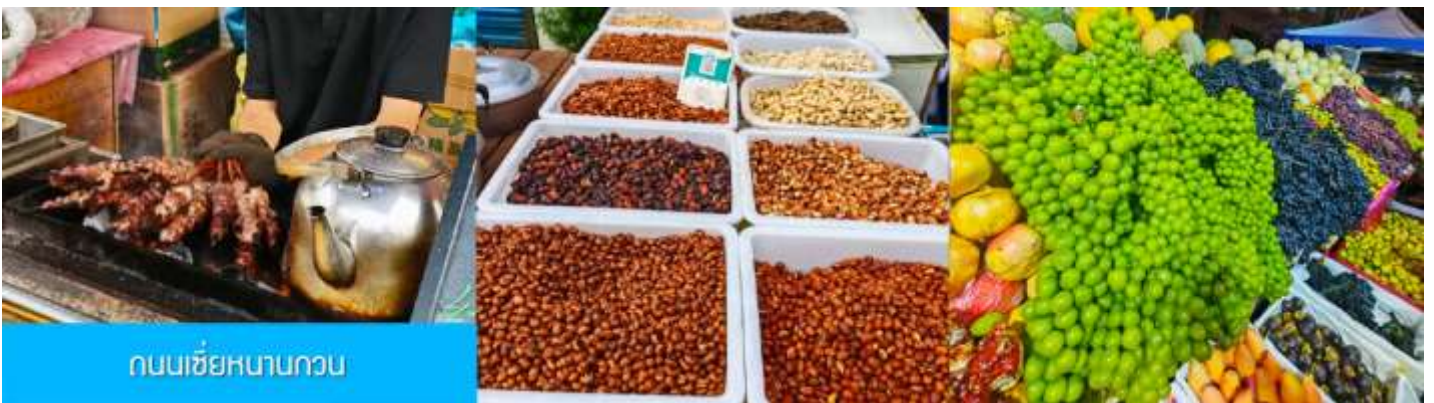
ถนนเซี่ยหนานกวน

หลังอาหารนำท่านเดินทางโดยรถบัสสู่ เมืองซีหนิง 西宁 (ระยะทาง 289 กม. ใช้เวลาเดินทางราว 3 ชั่วโมงเศษ)