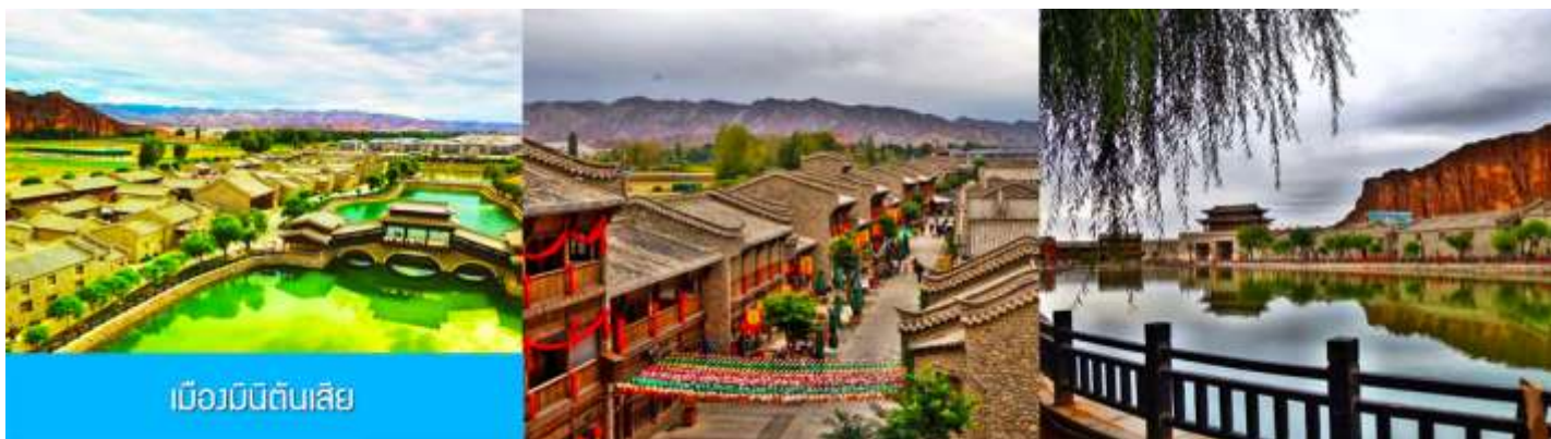
เมืองมินตันเสี่ย