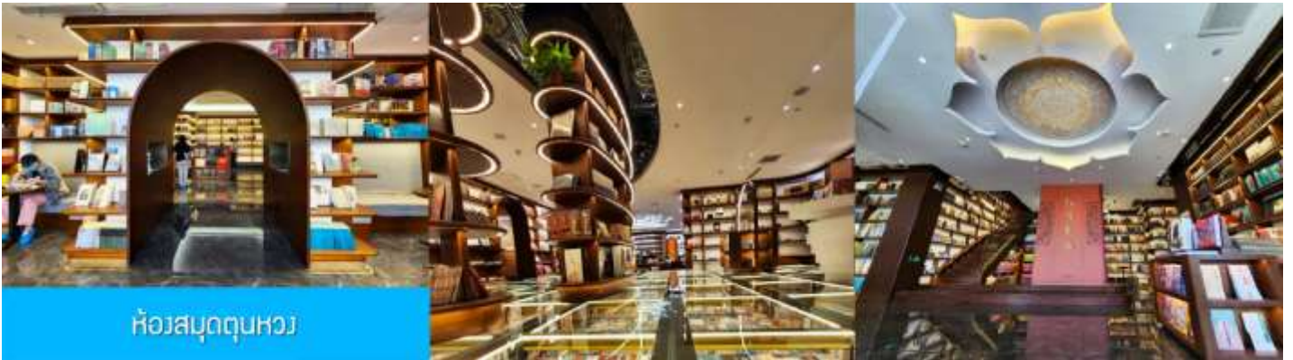
ห้องสมุดตุนหวง

ค่าทัวร์ไม่รวมค่ากิจกรรมค่ากิจกรรมอื่น ๆ อาทิ ค่าขึ้นอุฐ 130 หยวน นักท่องเที่ยวสูงวัยไม่แนะนำให้ขึ้นอุฐ ค่าเช่ารถสตูดิโอรถลยทะเลทราย (สอบถามราคาจากไกด์) และค่าอุปกรณ์รถเทากันทรายคู่ละ 20 หยวน)