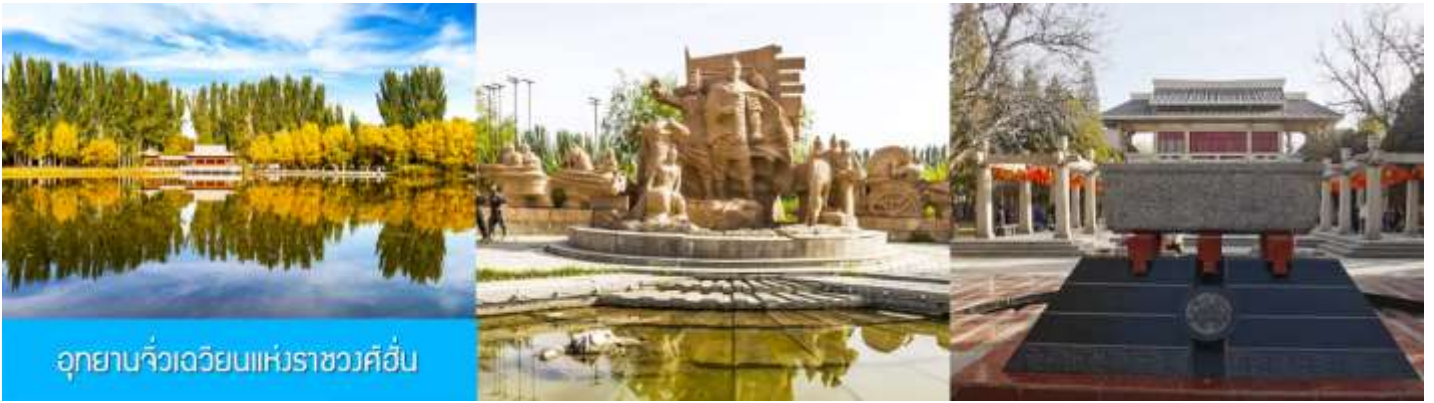
อุทยานจิ๋วเวียนแห่งราชวงศ์ฮั่น