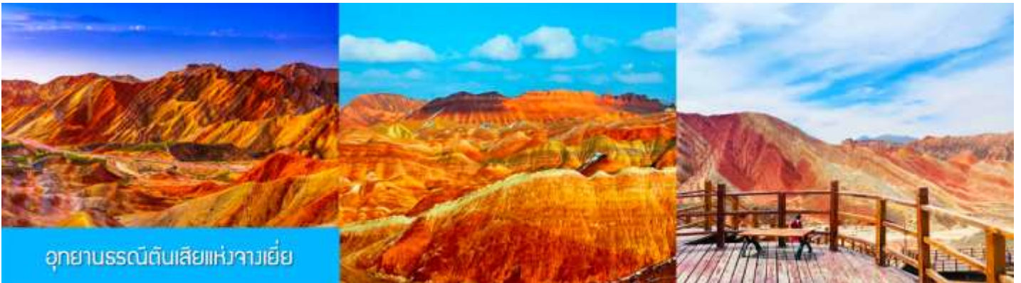
อุทยานธรณีสันตีสยามแห่งจางเยี่ย

หลังอาหารนำท่านเดินทางสู่เมืองจางเยี่ย 张掖 (เดินทางไกลระยะทาง 205 กิโลเมตรใช้เวลาประมาณ 2 ชั่วโมง ครึ่ง)