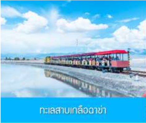
ทะเลสาบเกลือฉาซ่า