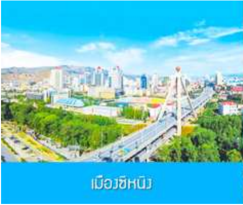
เมืองซีหนิง