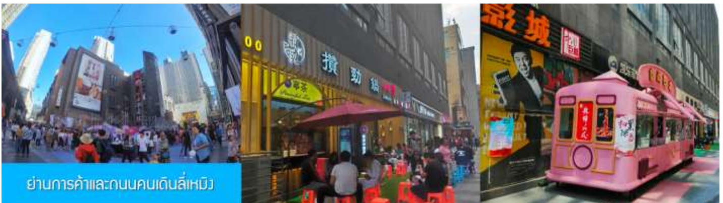
ย่านการค้าและถนนคนเดินลี่เหมิง

เที่ยง รับประทานอาหารกลางวัน ณ ภัตตาคาร (18)