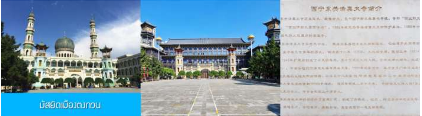
มัสยิดเมืองตงกวน

เช้า บริการอาหารเช้า ณ ร้านอาหารในโรงแรม (17)