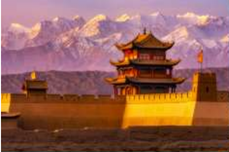
ด่านเจียวกวอน

เช้า รับประทานอาหารเช้า ณ ห้องอาหารของโรงแรม (12)