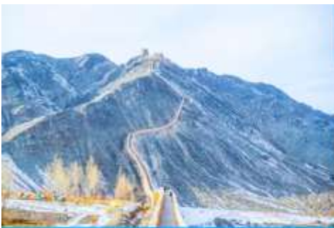
กำแพงเมืองจีนเสวียนปี