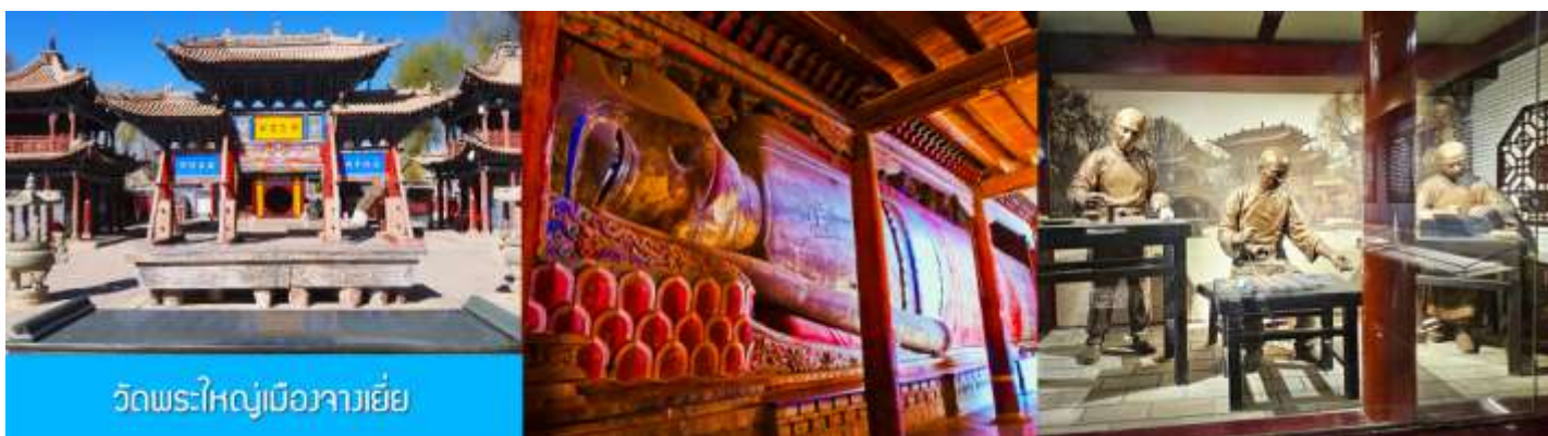
วัดพระใหญ่เมืองจางเยี่ย

รับประทานอาหารเช้า ณ ห้องอาหารของโรงแรม (15)