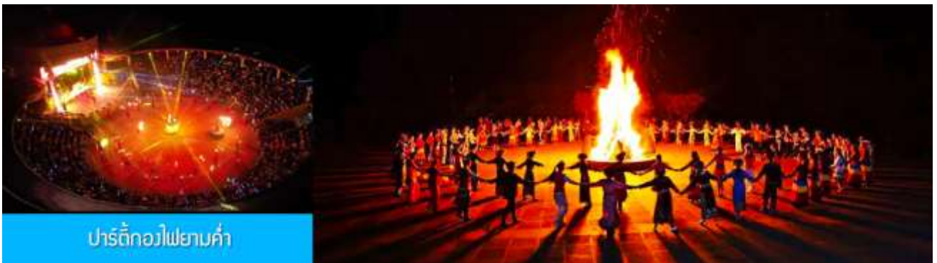
ปาร์ตี้กองไฟยามค่ำ