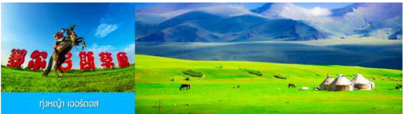
ทุ่งหญ้า เออร์ดอส

พักที่ ORDOS BOYU AIRUI HOTEL โรงแรมระดับ 4 ดาวท้องถิ่น หรือเทียบเท่าในเมืองเออร์ดอส