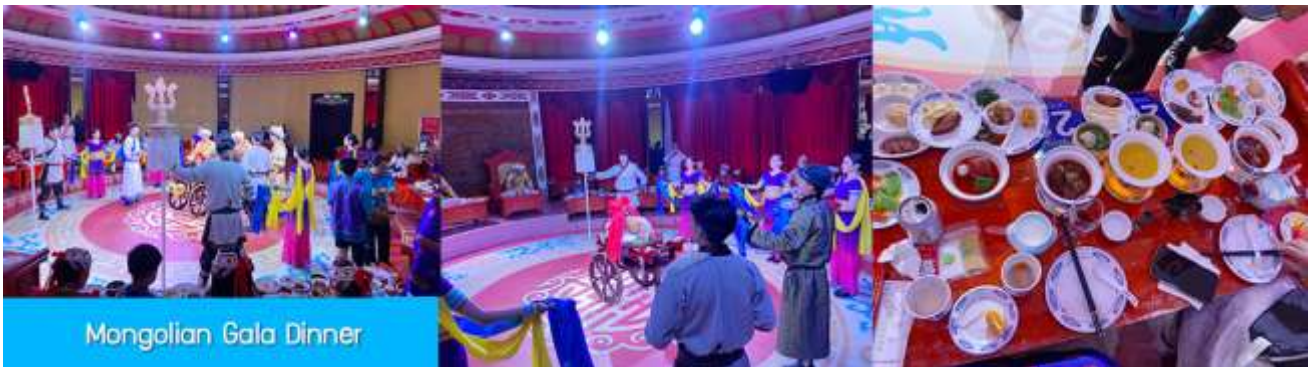
Mongolian Gala Dinner

那达慕 Naadam Festival หรือเทศกาลเฉลิมฉลองที่คล้ายวันตรุษจีนของชาวจีน ประกอบด้วยกิจกรรมพื้นเมืองแบบมองโกลรวม 22 อย่าง ได้แก่ พิธีแต่งงานเออร์โดส / การขี่ม้าในสนาม / ปาร์ตี้รอบกองไฟ / จั๊มม้าถ่ายรูป / สไลเดอร์หญ้า / รถลากทุ่งหญ้า / สวนเขาวงกต / สวนเด็กเล่น / ดิกอล์ฟทุ่งหญ้า / รถบัมเปอร์ / รถโคคาร์ท / โยนบอลทุ่งหญ้า / ปืนไฟมองโก / ยิงธนูในร่ม / แข่งขันจับแกะ / คล้องม้าจำลอง / หมูเลี้ยงนำเอ็นดู / เครื่องเล่นหมุน / เลี้ยงแกะโยน / ยิงธนู / ทอยแจกัน / เซ็นต์ชื่อภาษามองโกให้เลือกเล่นได้ 12 อย่างตามรายการที่ระบุ.....อัตราค่าบริการสำหรับ 那达慕 Naadam Festival 380 หยวน หรือ 1,900 บาท/ท่าน (สำหรับลูกค้าทัวร์ที่ไม่ซื้อโปรแกรมเสริม สามารถเดินเล่น ถ่ายรูปบริเวณทุ่งหญ้าหรือพักผ่อนตามอัธยาศัย)