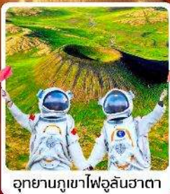
อุทยานภูเขาไฟอูลันฮาตา