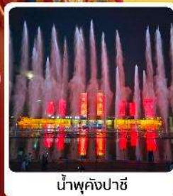
น้ำพุคังปาซี

● ไอลี่ เป็นทราเวลสายการบิน 5A ของจีน ภูเขาไฟอูลันฮาตา น้ำพุคังปาซี น้ำพุที่สูงที่สุดในเอเชีย