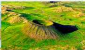
อุทยานภูเขาไฟอูลันฮาตา