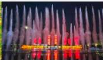
น้ำพุคังปาซือ