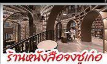
ร้านหนังสือจขเกอ