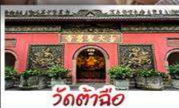
วัตต่าฉือ