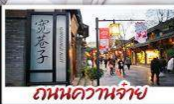
ถนนความจ่าย