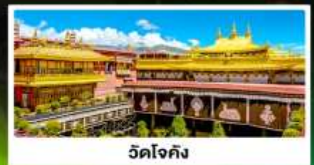
วัดโจกิง