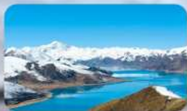
ทะเลสาบยิมครก