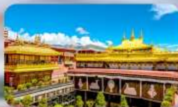
วัดโจกิง