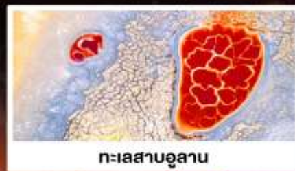
ทะเลสาบอูแลกัน