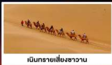
เป็นทรายเสี่ยงชาวน