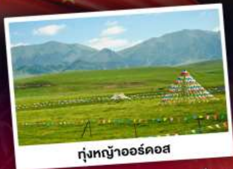
ทุ่งหญ้าออร์ดอส