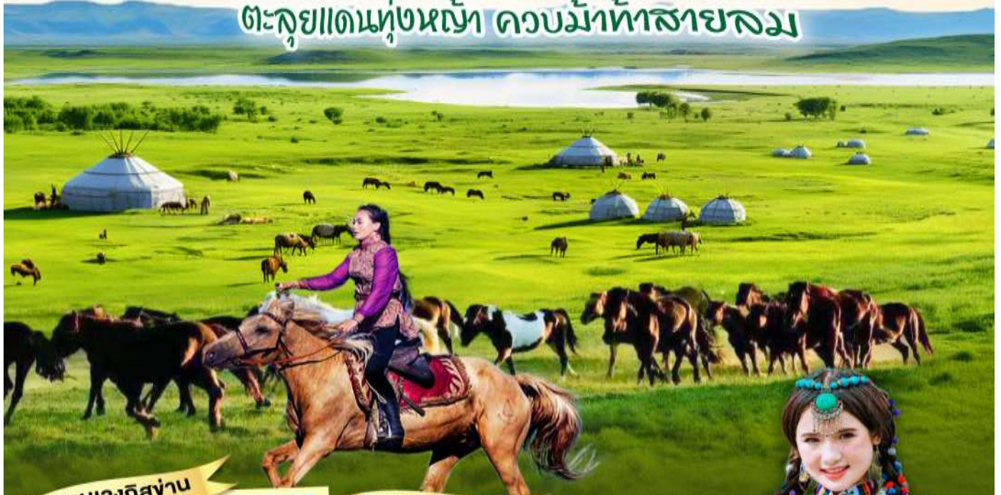
สุสานเจงกิสข่าน