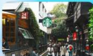
ถนนชอยกวางซวยแคบ