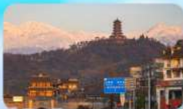
เมืองโบราณกวนเสี้ยน