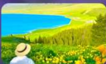
ทะเลสาบไซ่หลี่มู่