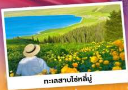
ทะเลสาบไซหลี่มู่

ถ่ายรูปทุ่งดอกลาเวนเดอร์ - กุ้งหนัวคาลาจัน SKY GRASSLAND กุ้งหนัวมรดกโลก