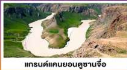
แกรนด์แคนยอนคูซานจื่อ