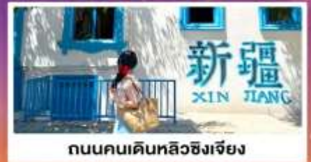
ถนนคนเดินหลิวซิงเจียง