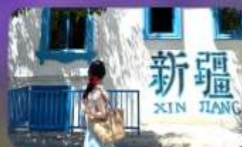
ถนนคนเดินหลิวซิงเจียง