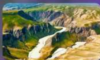
แกรนด์แคนยอนคูซานจื่อ