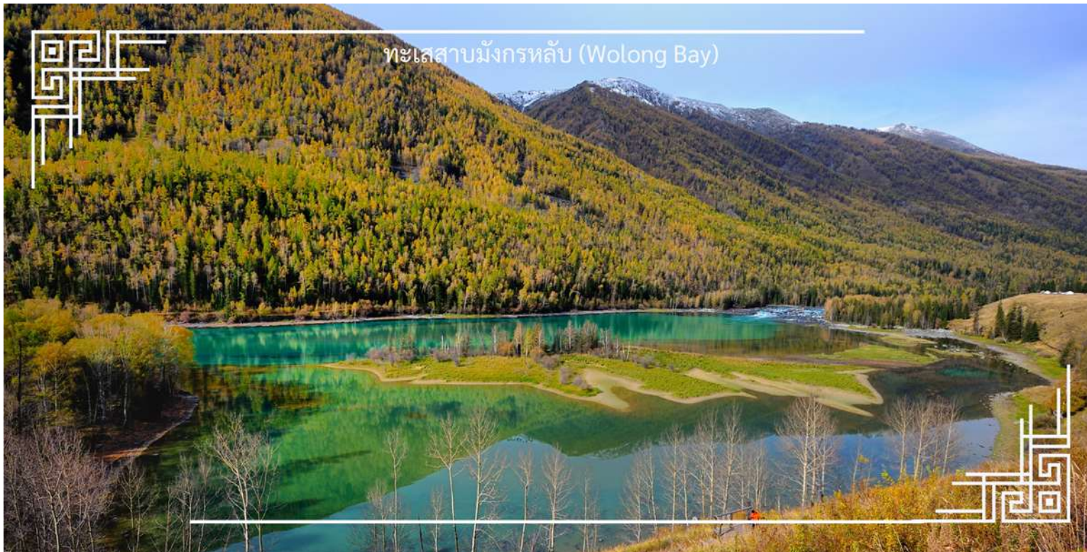
ทะเลสาบมังกรหลับ (Wolong Bay)

จากนั้นนำท่านชม ทะเลสาบเทวดา (Fairy Bay) จุดชมวิวยุคไฮไลต์ที่ตั้งอยู่ทางตอนใต้ของทะเลสาบคานาสีอู่ ภายในเขตโดดเด่นด้วยผืนน้ำใสสะท้อนเงาภูเขาและผืนป่า สร้างบรรยากาศราวดินแดนในเทพนิยาย สถานที่แห่งนี้มีชื่อเรียกตามตำนานท้องถิ่นว่า “อ่าวของเหล่าเซียน” โดยเล่าขานกันว่าเป็นสถานที่ที่เหล่าเทพเซียนลงมาเล่นน้ำ จึงยิ่งเพิ่มเสน่ห์และความลึกลับให้กับทัศนียภาพอันงดงาม