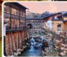
เมืองโบราณเหย้าหู