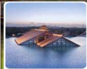
พิพิธภัณฑ์ไดน้ำ กวางฟู่หลิน