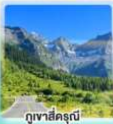
ภูเขาสิ่วรุณี