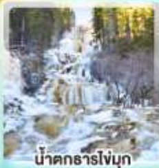
น้ำตกธารไถ่บูก