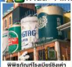
พิพิธภัณฑ์เบียร์ชิงเต่า