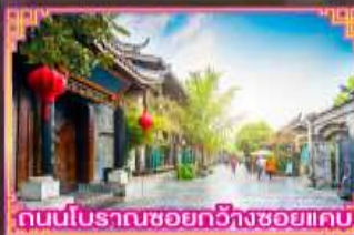
ถนนโบราณซอยกว้างซอยแคบ