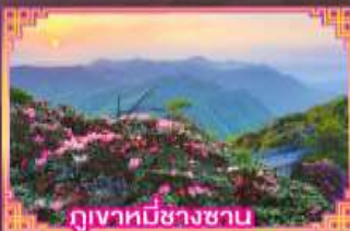
ภูเขาที่มีชาวชน