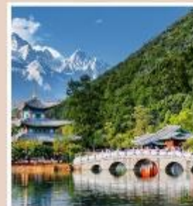
สะพานมังกรดำ