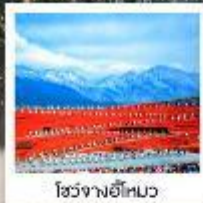
โจวจางอีไห่หมว