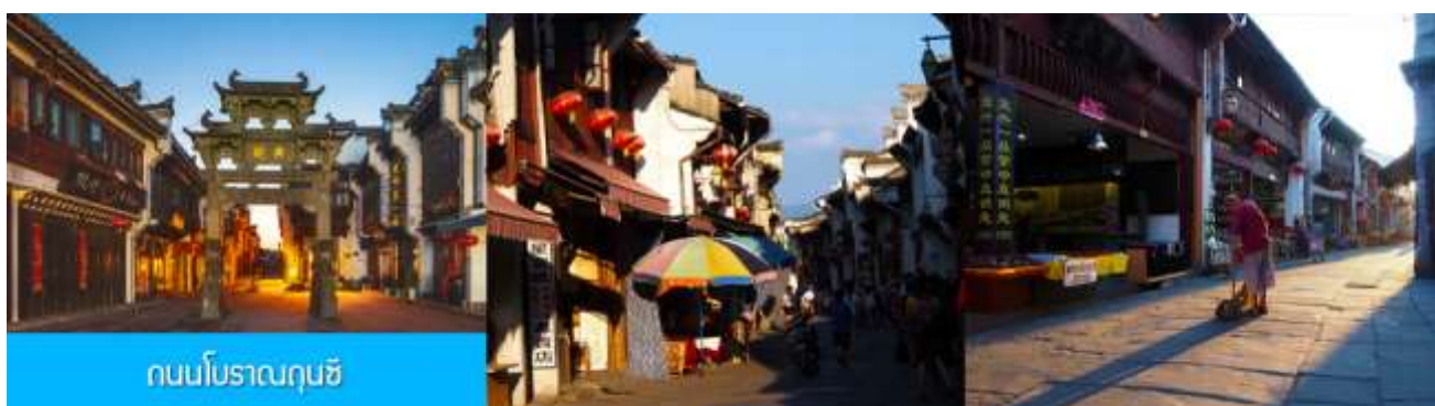
ถนนโบราณถุนซี

เที่ยง อิสระอาหารมื้อกลางวัน ( ท่านสามารถเลือกชิมอาหารพื้นเมืองในระแวกโรงแรมได้ตามอัธยาศัย )