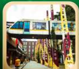
“ดงเจียวจื่อ”