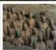
พิพิธภัณฑก์องทัพใต้ดิน