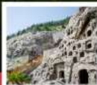
ท่าหลงเหมิน

ตลาดกลางไคเฟิง / ศาลไคเฟิง / ประตูเมืองท่าต้าเหลียนเหมิน / สวนชิงหิงซึ่งเหอ อุทยานหยุนโกซาน / วัดเล่าหลิน / ป่าเจดีย์ / โชว์วิถียกยูกุเอ่เล่าหลิน / โชว์ SHAOLIN MUSIC CEREMONY ท่าหลงเหมิน / ชมดอกโบตั๋น / ถนนคนเดินสี่จั๊งเหมิน / เมืองโบราณคิ้วอี้ (ฟรีใส่ชุดพื้นเมืองชาวฮั่น) กำแพงเมืองอิงเกียนเหมิน / พิพิธภัณฑก์องทัพใต้ดินทหารม้าจีนซี / โชว์ราชวงศ์ถัง / กำแพงเมืองโบราณซีอัน จัตุรัสหอรบะฮิง + หอกสอง / ตลาดมุสลิม / JOY CITY / เจดีย์ห้าพันปีใหญ่ / ถนนคนเดินวัฒนธรรมต้าถ้ง