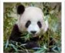
ศูนย์อนุรักษ์หมีแพนด้าจู่เจียงเยียน