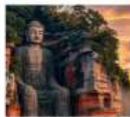
ทิวทัศน์หวงโถ่เค่อซาน