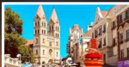
โบสถ์เซนต์ไมเคิล