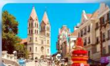
โบสถ์เซนต์โมเคิล