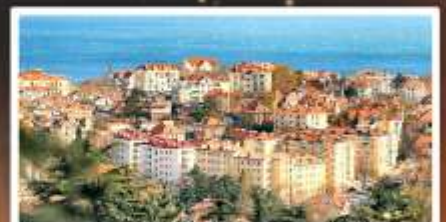
จุดชมวิว Signal Hill Park