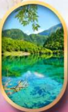
จิ่วจ้ายโกว