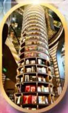
หอหนังสือจางชู่เก๋