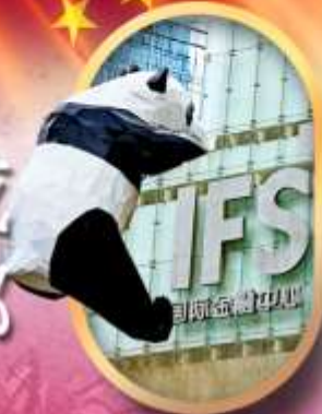
IFS หมีแพนด้าป็นตึก