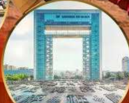
ประตูแห่งความสุข