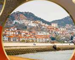
ซาจื่อไห่