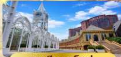
ระเบียบยุโรป