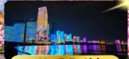
หาด No.3 Bathing

เมนูพิเศษ อาหารซีฟู้ด 6 วัน 4 คืน เดินทาง : เมษายน 69