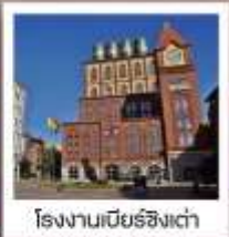
โรงงานเบียร์ชิงเต่า