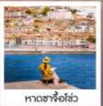
หาดซาโจ่วไฮ่

เรือลู่กั๋ว / ย่านฉินเหล่ฟาง / สวนเว่ยไห่ / WEI HAI WINDOW / ถนนฮวงวีป้า สวนหมื่นปีโกเมน / เมืองท่าฮั่วฉิงไห่ / หอคอยตาคองคา / สามหาดจินซา / รูปปั้นปลาฉลาม แปดเซียนซำทง / หาดทรายซาโจ่วไฮ่ / หาดไฮเบอร์ NO.3 / สวนจงซาน / ถนนหลงเจียง พิพิธภัณฑ์ที่ว่าการท่าเรือเมอร์บิน / Silver Fish St. / สะพานจินเจียว / โบสถ์ St. Emil ถนนเป่าฉ่าทง / ห้างเว่ยซานไห่หิจิม NIGHT MARKET / QINGDAO HAITIAN CENTER ชั้นB1 โรงงานเบียร์ชิงเต่า / ถนนเลียบชายหาดปิ่นไห่ปูจ้านเต่า / ถนนคนเดินไถ่ตง