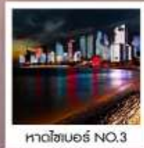
หาดไฮเบอร์ NO.3

ซิมฟรี!! ...เบียร์ชิงเต่า สูตรออริจินัลดั้งเดิม ...ท่านละ 1 แก้ว