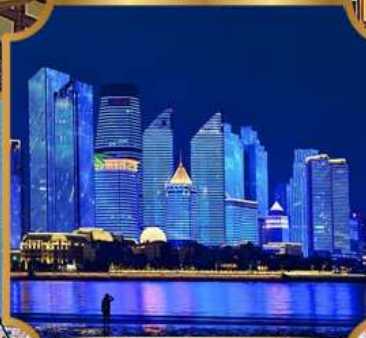
หาดโซเบอร์ฟังก์