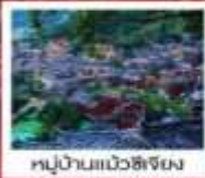
หมู่บ้านแมวสีเงิน