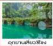
อุทยานเสี้ยวซือจง