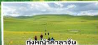
ทุ่งหญ้าคาลาจูน