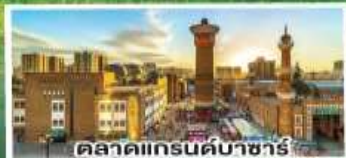
ตลาดแกรนด์บาซาร์