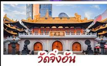
วัดจิ่งอัน