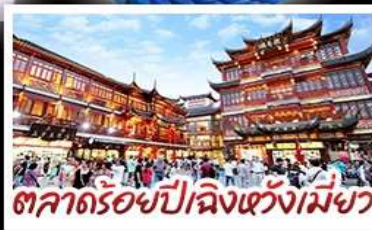
ตลาดร้อยปีเฉิงหวังเมี่ยว