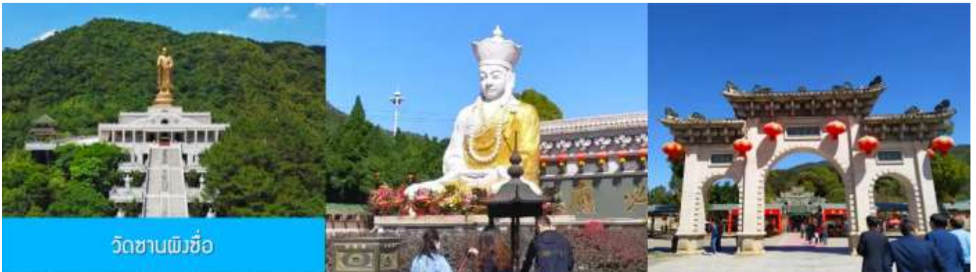
วัดซานผิงซื่อ

หลังอาหารนำท่านเดินทางโดยรถบัสสู่ เมืองจางโจว 漳州 (ระยะทาง 159 กม.ใช้เวลาเดินทางราว 2 ชั่วโมงเศษ)