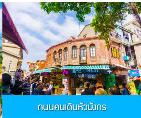
ถนนคนเดินหัวมังกร