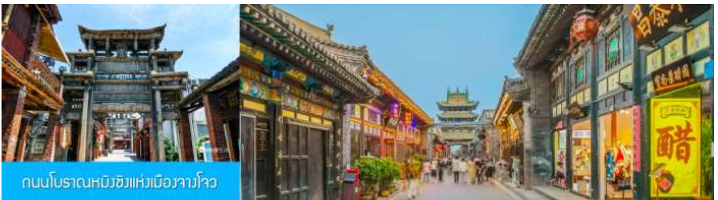
ถนนโบราณหมิงชิงแห่งเมืองจางโจว