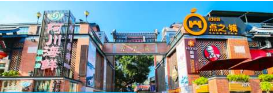
หมู่บ้านชาวประมง เจิงจ้าวอัน