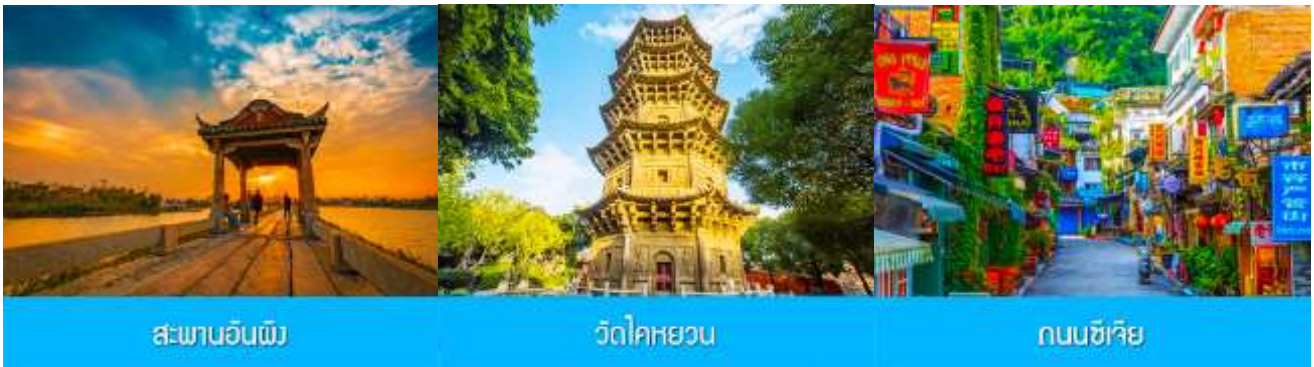
สะพานอันผิง