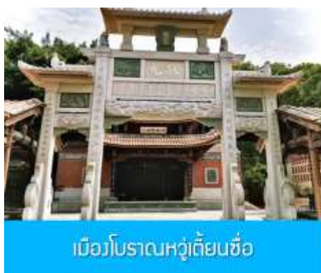
เมืองโบราณหวู่เตี้ยนซือ

พักที่ โรงแรม XIAMEN HENGLONG HOTEL 4* หรือเทียบเท่าในเมืองเซี่ยเหมิน