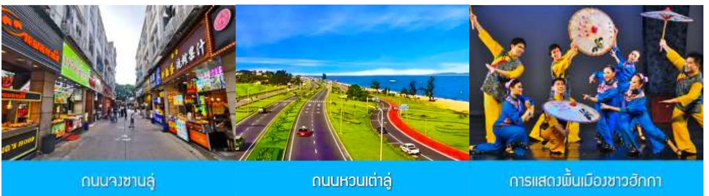
ถนนวซาลู่

พักที่ โรงแรม XIAMEN HENGLONG HOTEL 4* หรือเทียบเท่าในเมืองเซี่ยะเหมิน