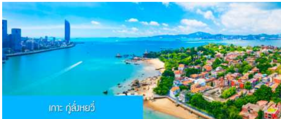
เกาะ กู่ลิ่งหยวี