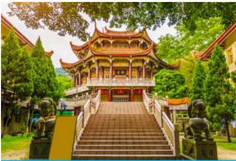
วัดหนานถั่วชื่อ

ค่ำ รับประทานอาหารค่ำ ณ ภัตตาคาร (1) พักที่ โรงแรม XIAMEN HENGLONG HOTEL 4* หรือเทียบเท่าในเมืองเซี่ยเหมิน