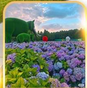
ดอกไม้ตามฤดูกาล