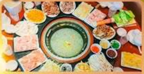
สุกี้เด็ด