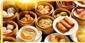
อาหารกวางตุ้ง